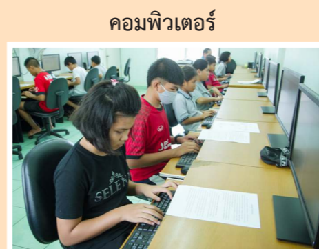
คอมพิวเตอร์