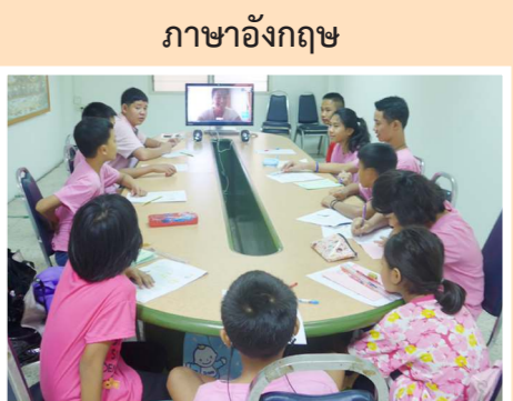
ภาษาอังกฤษ