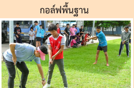
กอล์ฟพื้นฐาน

กิจกรรมภายในบ้าน ของบรรดาเด็ก ๆ ช่วงปิดเทอมและ สถานการณ์โควิด 19