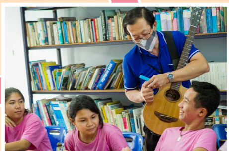
ดนตรีสากล