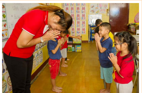
มารยาทไทย