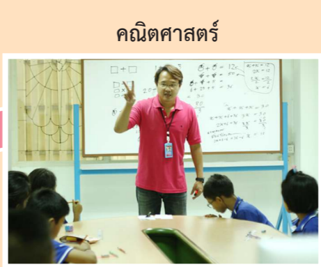
คณิตศาสตร์